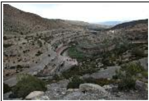
Titanique naturel di/von Az Alarabe Aloui

Die ausgewählte Fotos des Fotowettbewerbs