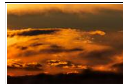
Tramonto alpino di/von Mauro Bertolini