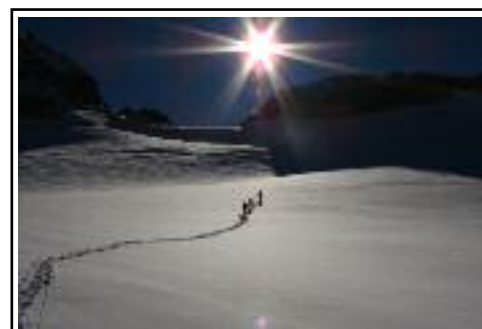
La traccia di/von Cristian Colli