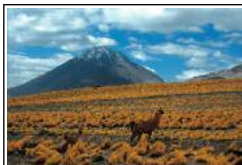
Mamma andiamo a scalare di/von Luciano Covolo