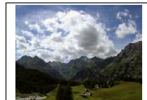
Come un dipinto di/von Cristina Pagani