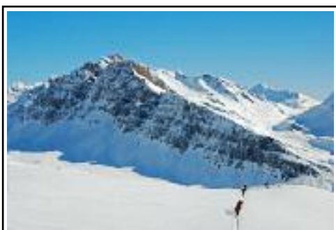
Linee d'ombra al Piz Uccello di/von Ettore Ruggeri